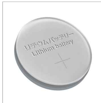
コイン型リチウム電池ケース