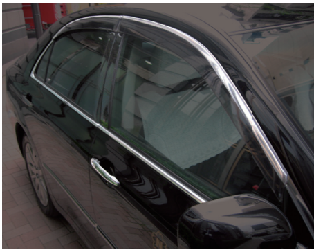
自動車用光モール