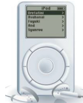
携帯音楽プレーヤー外装