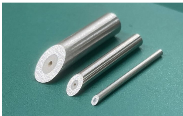
（左から）6.35mmφ×1.0mmφ・3.5mmφ×0.5mmφ（カラム管）、[新]1.59mmφ×0.12mmφ（キャピラリー管）

https://www.nipponkinzoku.co.jp/images/2019/01/20190129news-release.pdf