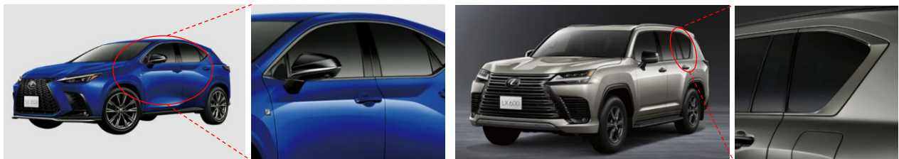
LEXUS NX F-SPORT

本製品は、第11次経営計画「NIPPON KINZOKU 2030」のビジョン（多種多様な素材の圧延・複合成形することで、最終製品に要求される性能を素材で実現し人と地球の未来に貢献します）に沿い、既存技術を深化することで機能を充実させ競争力を高めた製品（機能強化製品）の拡大を図ったもので、「FB」仕上の販売は、「M-FB」仕上※と合わせて、40トン/月を目標としております。